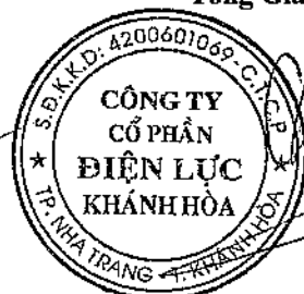
Nguyễn Cao Kỳ