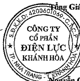
Nguyễn Cao Kỳ

Các thuyết minh từ trang 8 đến trang 37 là một bộ phận hợp thành của báo cáo tài chính riêng